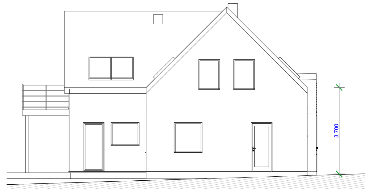
Fasad mot sydost 1:100